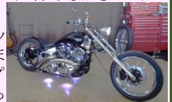
ピットと来たバイク

欲しくてほしくてたまらない病にかかり、ショップに電話して色々話を聞き、更にドツポにはまり、見に行く口実でショップにGO…。ショップでの話しや、その場で車両にまたがってしまった自分。止まりません。すぐさま奥様(普段言わない笑)に電話。仲良し夫婦の以心伝心(と信じよう)で、答えはやっぱり!! かかってくると思っていたと。色々話をし、「でどうしたいの?」と言われ、即答で「買う!」「好きにして!」ガチャ…プープープーって。俺も男だ! また来ますと泣く泣く帰宅。それから数日後、嫁から「バイクどうしたの?」、俺「諦めてないけど今回は帰ってきたと」。「で、どうするの?」「絶対買う!」これはどちらが手を引くかの勝負。男っていくつになっても子供なのですよ。家族・兄弟が猛反対の中、お風呂の掃除・ゴミ捨て・掃除・洗い物・嫁の趣味開放・お留守番を日々サポートし笑顔で対応。嫁の眉間のシワも撫でるようにマッサージ(笑) 今はみんなが明るい笑顔で待ち遠しい納車日を指折り数えています。